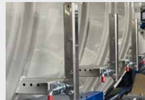
Rohr- und Schlauchhalter