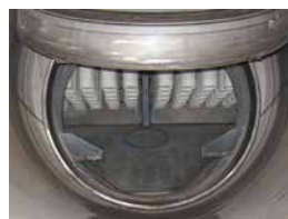
Zugang zur Filterkammer