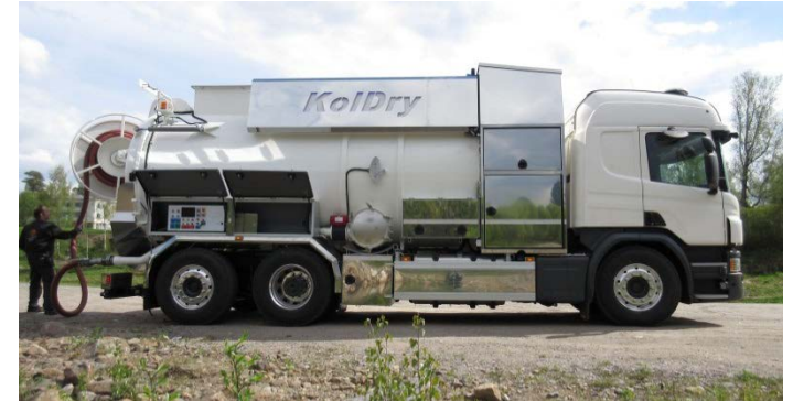
Slambrunnstömning med KolDry Kaivon tyhjennys KolDry-ajoneuvolla

KolDry-laitteen käyttö on erittäin yksinkertaista. Prosessia voidaan valvoa säiliön asennetulla kameralla. Veden palautus kaivoon tapahtuu samalla imuletkulla, jolla (sako)kaivo aluksi tyhjennettiin.