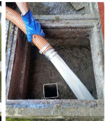
Retur av vatten till slambrunn Veden palautus kaivoon